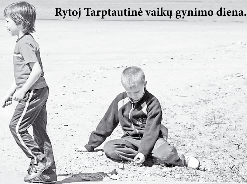
Rytoj Tarptautinė vaikų gynimo diena.